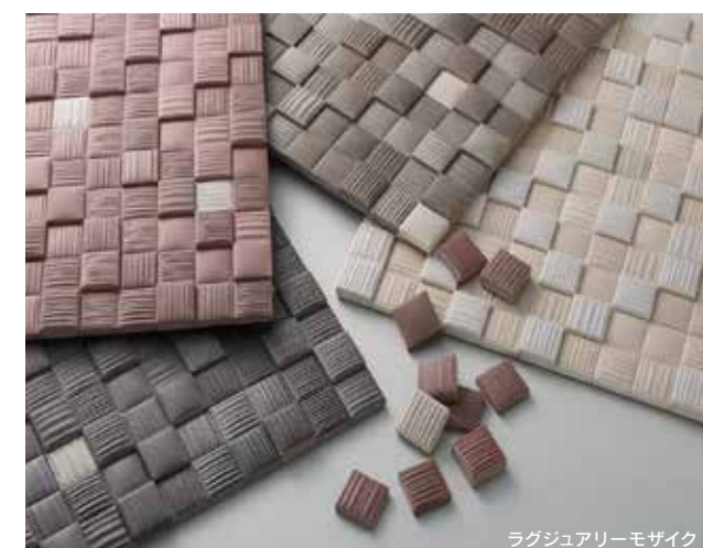
ラグジュアリーモザイク